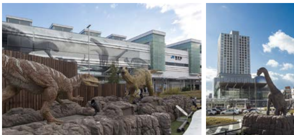
恐竜モニュメントの設置

新たな恐竜モニュメントや最新のデジタル技術を活用した恐竜が飛び出すARディスプレイの設置など、県、福井市、地域が一体となって恐竜エリア拡大に取り組み、駅周辺の回遊性を高め、憩いとにぎわいのエリアを創出していきます。