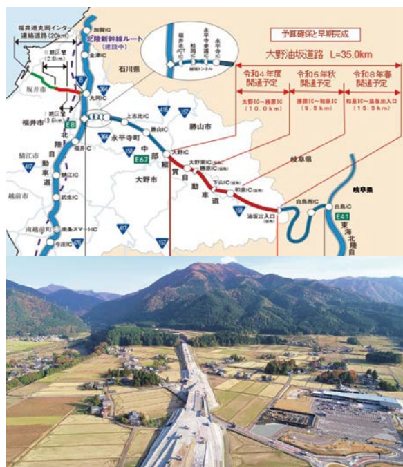
中部縦貫自動車道と道の駅「越前おおの 荒島の郷」

中部縦貫自動車道は、長野県松本市を起点とし福井市に至る約160kmの高規格幹線道路（自動車専用道路）であり、2026年春に福井県内の全区間が開通予定となっています。この区間は、無料で通行ができ、本県と中京圏とがより身近につながるようになります。沿線の大野市では、道の駅「越前おおの 荒島の郷」が開駅し、新しく完成した産業団地にアウトドア用品メーカーが進出するなど、中京圏からの観光誘客や企業誘致を見据えたまちづくりが進んでいます。