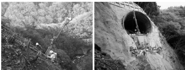
急峻な地形上での法面や橋梁基礎工事の状況

猪ノ鼻道路は平成15年度に新規事業化、平成19年度から工事着手し、急峻な山間部に新猪ノ鼻トンネル（延長4,187m）を含む4本のトンネルと4本の橋梁で貫くなど難工事であったが、17年という長い年月を経て、令和2年12月13日に開通した。開通記念パレードでは、徳島県三好市の観光で有名なボンネットバスを先頭にスタートし、沿道には開通を待ち望んでいた地域の皆様が見送りに来てくださるなど、この事業がいかに地域に望まれていたかを象徴する光景となった。