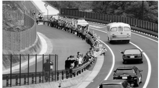
開通記念パレードの状況