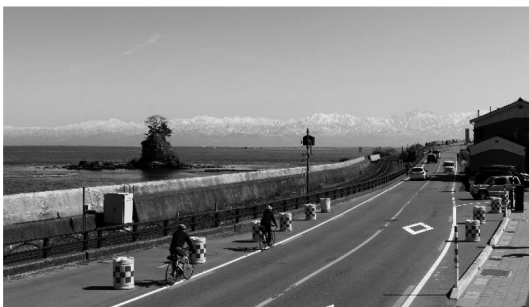
富山湾に浮かぶ立山連峰

富山湾に浮かぶ3,000m級の立山連峰、日本海側最大級の斜張橋「新湊大橋」と帆船海王丸、美しいエメラルドグリーンのはすい海岸、自然の光と風が織りなす蜃気楼、これらの美しい景観を楽しみながら走行できる点が最大の特色である。