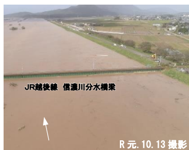
図6 令和元年東日本台風洪水時のJR越後線地点での流況

これを受け、令和元年東日本台風洪水と同規模の洪水に対して、家屋の浸水被害の防止又は軽減を図るため、河川整備計画を令和4年12月に変更した。これに伴い、大河津分水路改修事業においても、上流の低水路拡幅のための掘削を追加し、事業期間も令和20年度まで変更した（図7）。