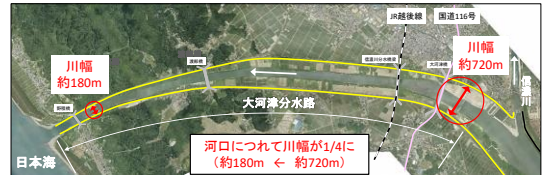
図1 大河津分水路の河道形状

これらの課題を解決するため、平成27年度より川幅を約100m拡幅し、第二床固の下流に新たな床固を設置する事業に着手している（図3）。この事業により、大河津分水路の上流に位置する長岡地区の洪水処理能力も向上し、信濃川水系全体の洪水処理能力を向上させることにつながる。