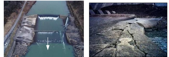
図2 老朽化が進行する第二床固