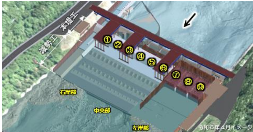
図4 第二床固改築工事の進捗状況

また、本事業では、「3次元データ」を活用し、施工状況を可視化するなどし、事業の効率化を目的とした取り組みも行っている（図5）。