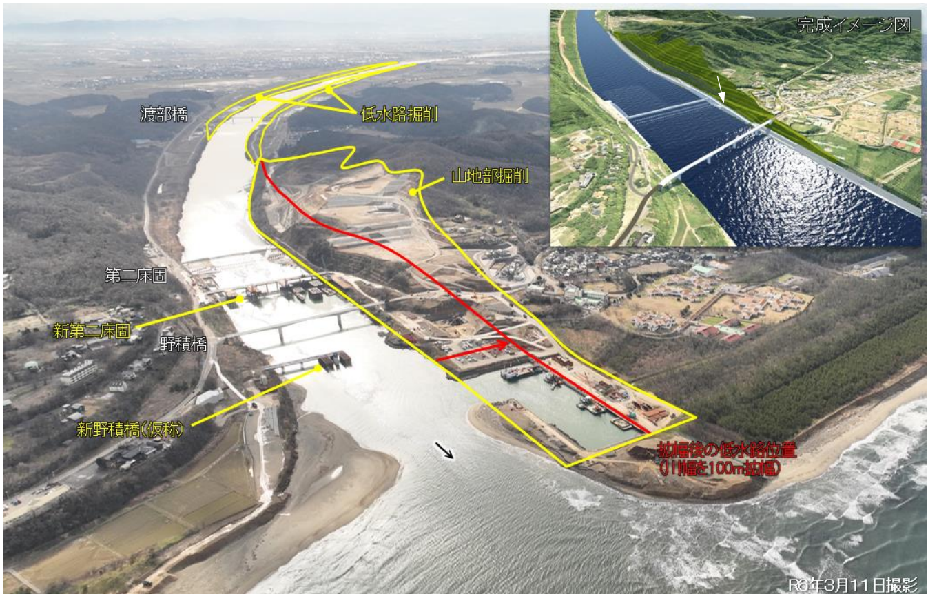
図3 現在の事業実施状況