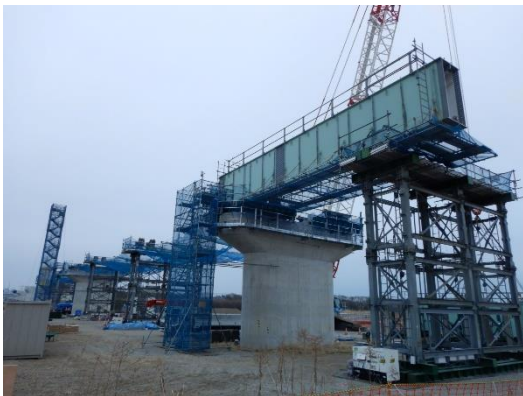
クレーンベント架設状況