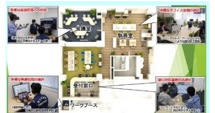
図-8 執務室レイアウト

これらの様々なツールを用いて事務所と出張所、現場を一元的に接続することが可能であり、迅速な情報共有や意思決定が可能となっている。