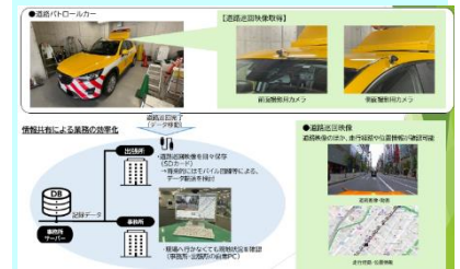
図-5 車載カメラ映像の共有

今回の取組により、区画線等の塗替必要箇所を定量的かつ効率的に把握でき、業務の効率化に寄与している。