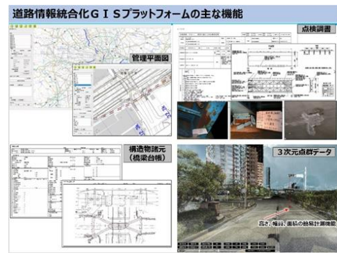
GISプラットフォーム(DXアプリ)