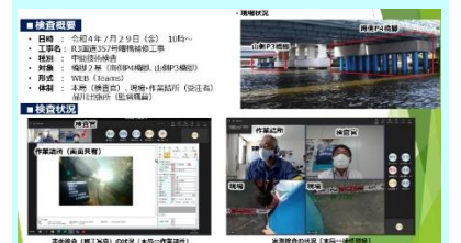
図-7 遠隔臨場検査の例

また、3次元モデルによる施工シミュレーションにより、機材の配置、材料の投入位置や据付手順等の確認を行うことで、施工計画の最適化を図っている。今回、品川出張所のDX整備により、管内の各工事現場に遠隔臨場や3次元モデルの活用に必要なVR 機器などの設備や執務環境が整備され、更なる効率化が期待される。