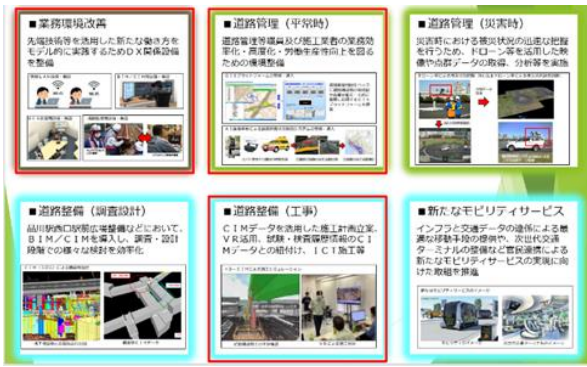
東京国道DXの取り組み