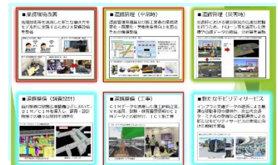
図-1 東京国道事務所におけるDXの取組

今回、品川出張所では、東京国道事務所での先行モデルとして、6つの分野のうち平常時の道路管理、道路整備のうち工事の実施段階におけるDX化、業務環境改善を実施している。