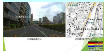
図-6 車載カメラ映像の活用事例