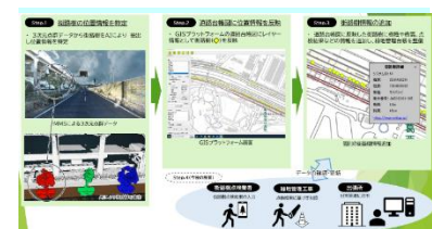
図-4 緑地管理台帳データ化手順

また、緑地管理台帳のデータ化においては、橋梁やトンネルなどは、施設毎に緯度経度の情報を取得していることから、その情報を基にGIS上に位置を反映させることが可能だが、管内で植栽されている高木や中低木については大まかな位置や樹種等の情報が紙資料の緑地管理台帳として整理されていた。しかし、GIS上に位置を反映させるために必要となる緯度経度の位置情報は取得されていなかった。街路樹の位置情報を効率的かつ正確に反映するため、既存の3次元点群データから、街路樹をAIにより抽出し緯度経度の情報を特定することで位置情報に反映した。また、特定した位置情報に、樹種や樹木管理番号、樹高などの情報を追加し、緑地管理台帳として充実を図った。(図-4)