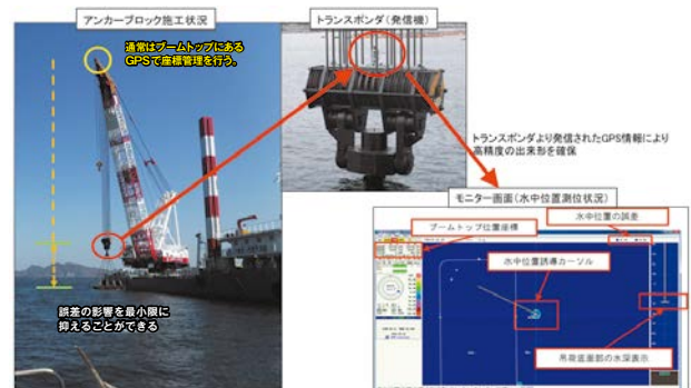
アンカーブロック施工状況

また、これらの方法を活用した防波堤整備の結果、漁港内に静穏な水域を確保でき、効率的・安定的な漁業活動の実現により基幹産業である水産業の活性化に寄与した。