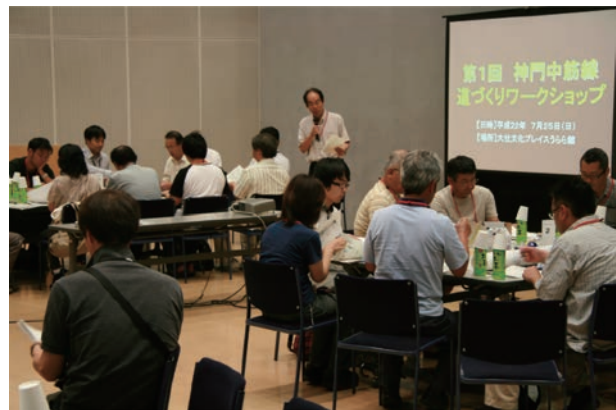
道づくりワークショップの状況