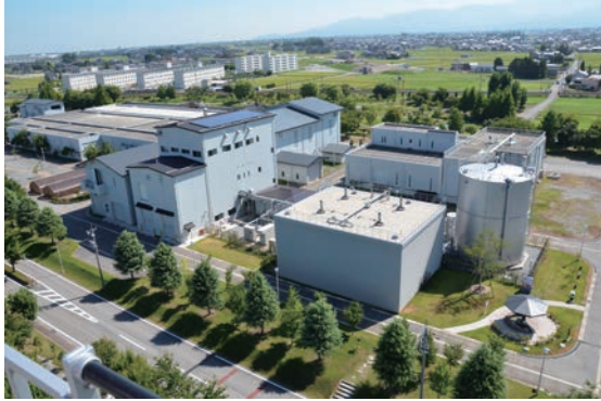
黒部市下水道バイオマスエネルギー利活用施設全景

事業名 黒部市下水道バイオマスエネルギー利活用施設整備運営事業 授賞機関 黒部市 実施期間 平成21年4月1日～平成23年4月31日