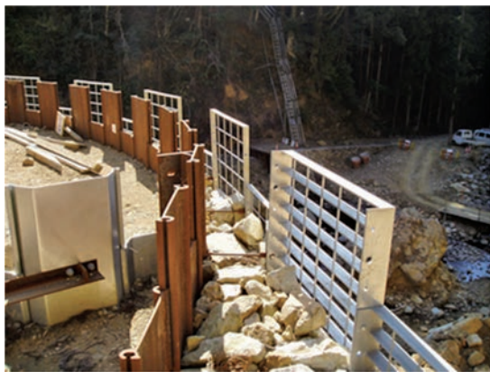
下流面の自然石中詰め状況

事業名 薬師谷川 通常砂防事業 授賞機関 愛媛県南予地方局建設部 実施期間 平成11年4月～平成24年11月