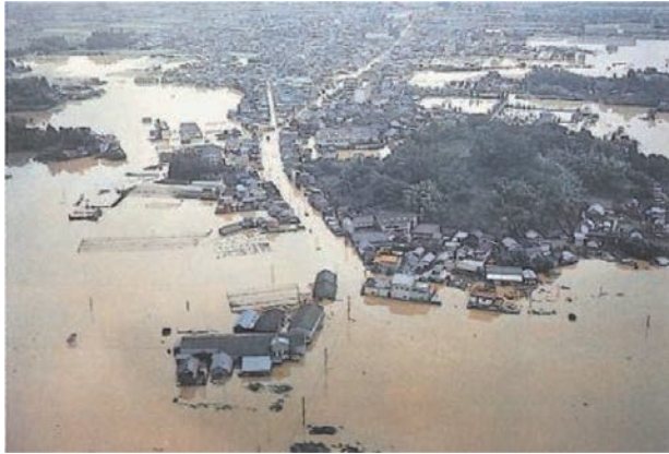
昭和50年8月 台風5号による被害

事業名 はげがわ 波介川河口導流事業 授賞機関 国土交通省四国地方整備局高知河川国道事務所 実施期間 平成16年3月17日～平成24年5月19日