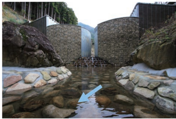
本提下流から望むダイナミックな砂防堰堤