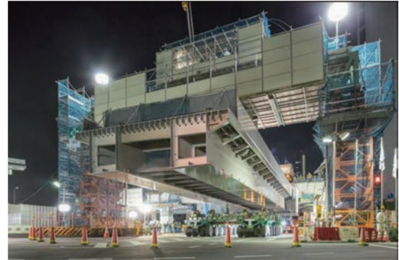
多軸台車と門形吊上げ式ベントを併用した一括架設 (桁吊上げ状況)