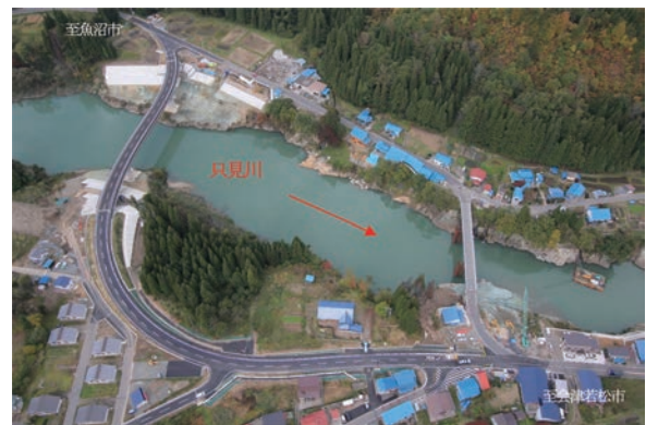
完成した二本木橋の新橋（上流側）と仮橋（下流側）