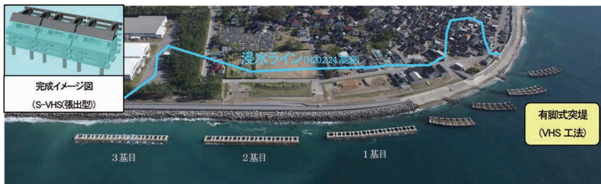
高波・越波から背後地を守る有脚式離岸堤群

事業名 下新川海岸有脚式離岸堤事業 授賞機関 国土交通省北陸地方整備局黒部河川事務所 実施期間 平成21年1月15日～平成24年11月12日