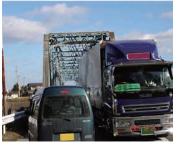
現丸森橋は幅員が狭小であるため車両のすれ違いが困難である

事業名 一般国道113号館矢間バイパス整備事業 授賞機関 宮城県大河原土木事務所 実施期間 平成8年4月1日～平成25年3月31日