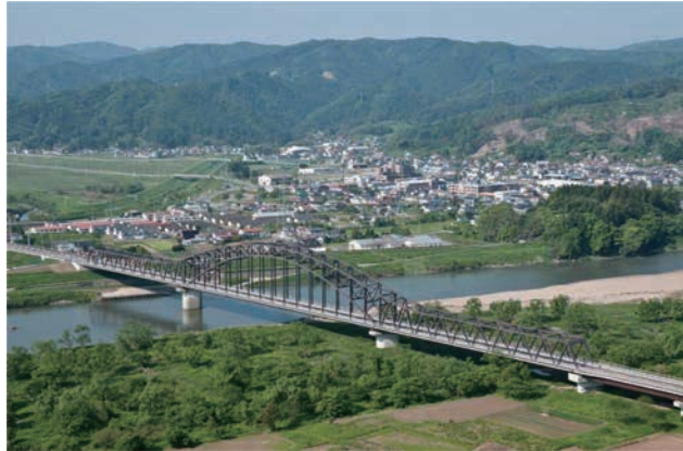
阿武隈山系を背景に町の中心部と橋が見事な一体感を示す