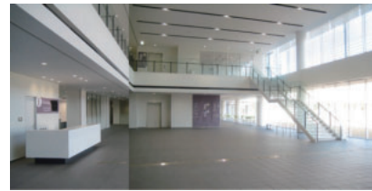
保健所・保健センター／フリーオープンスペース