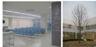
こども発達センター／中庭