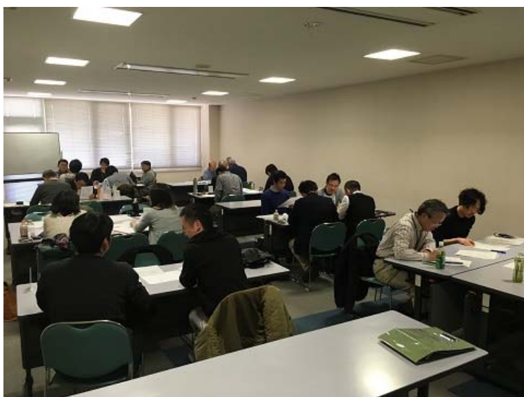
●●総監部門講義の様子●●