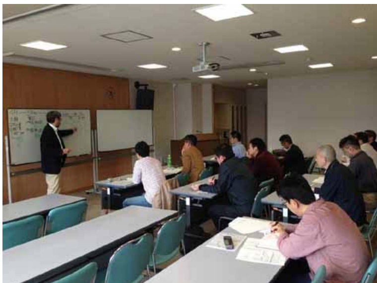
総監の講義 人数が多く、みなさん特に真剣でした。