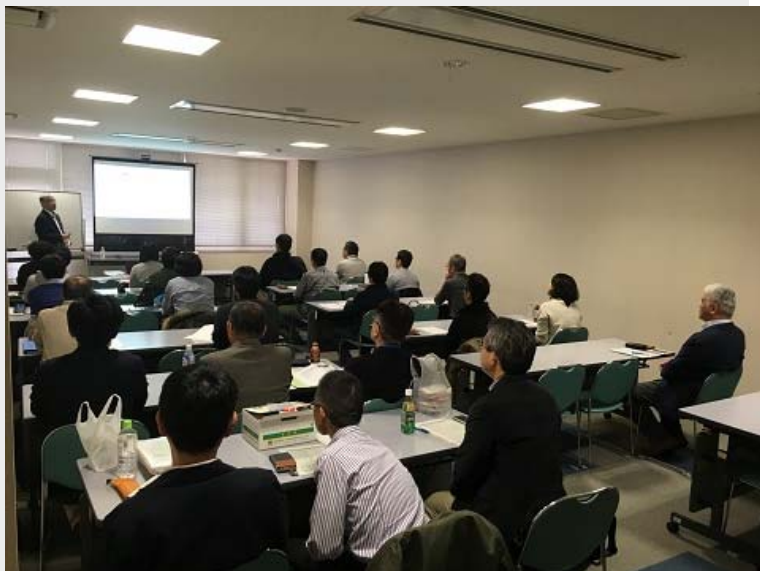
●●一般部門個別指導の様子●●