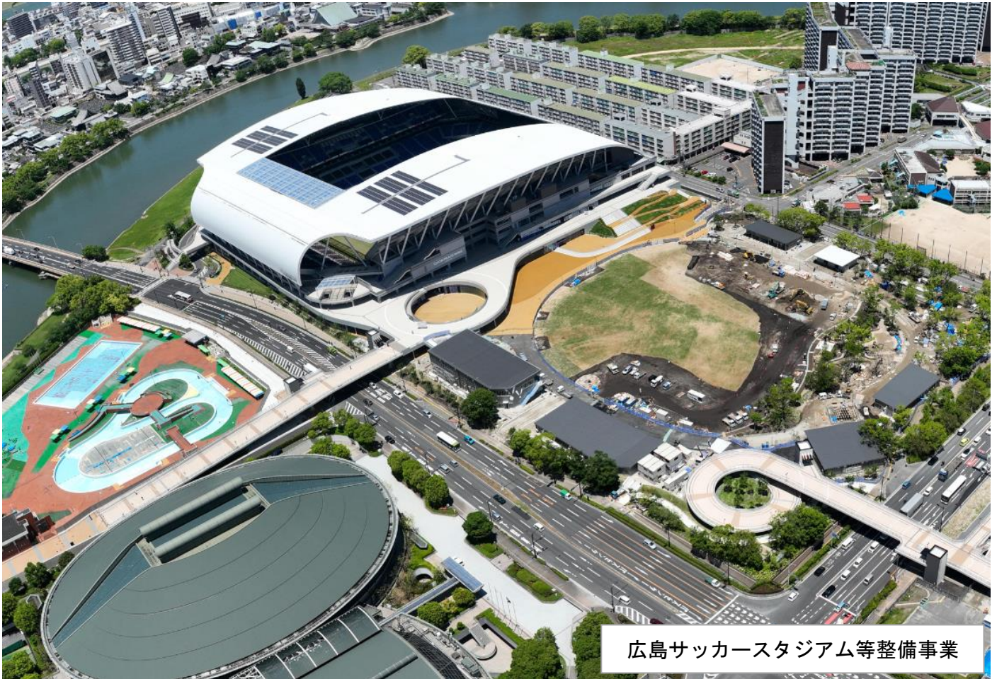
広島サッカースタジアム等整備事業