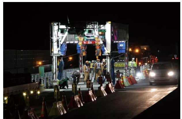
床版の撤去・架設機械による半断面施工

本工法は、(株)大林組保有の技術である超高強度繊維補強コンクリート（UFC）スリムクリートを応用した更新用プレキャストPC床版の継手構造（スリムファスナー）や移動式床版架設機、床版撤去技術などを用いて、工事を細かく分割して限られた時間内で既設床版の撤去から新たな床版の設置、路面復旧を行い交通開放できる施工方法である。本工事では、日々の限られた時間でのサイクル施工を可能とするため、それらの技術を取り入れた施工方法や日々の交通開放が可能なプレキャストPC床版の継手構造などの開発とともに、施工のために一時的に必要な仮設床版などを共同研究し、夜間1車線の交通規制で工事ができる新たな床版取替工法として開発した。