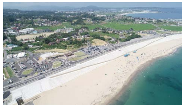
令和3年7月17日海水浴場オープン後の航空写真

大谷地区海岸の砂浜の再生をまちづくりの上位概念とし、地域の活動を通じて合意形成を図ることにより、防潮堤計画の見直しを進めることができた。また、治山海岸は保安林エリアより山側に海岸護岸施設を設置できない制約があるため、海岸の所管換を行うことで防潮堤を山側へ大きくセットバックし、砂浜面積2.8ha以上を確保することができた。このことにより、国道と背後地を嵩上げし、JR気仙沼線BRT大谷海岸駅を併設した道の駅を国道背後地に移転、国道の法面をベンチ状の防潮堤とすることで、海が見える景観を確保しつつ、法面自体も人が集える場所とし、親水性を高め、さらに海岸のどこにいても避難が可能な構造とすることが可能となった。