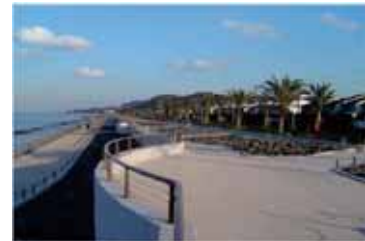
一部開放区間の利用状況