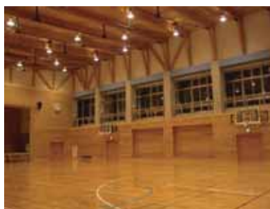
小学校体育館内観