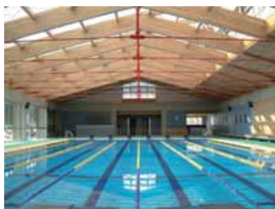
小学校プール内観