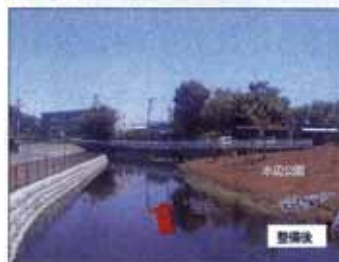
親水ゾーン（宮下橋下流）