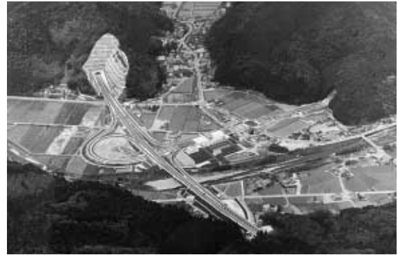
上空より朝来ICを臨む

なかでも虎臥城大橋は、国指定史跡竹田城跡や周辺の風景との調和に配慮し、RC12径間連続空腹式アーチ橋(橋長402m)を採用した。