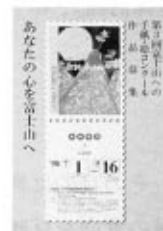
表 第2回富士山への手紙・絵コンクール応募総数